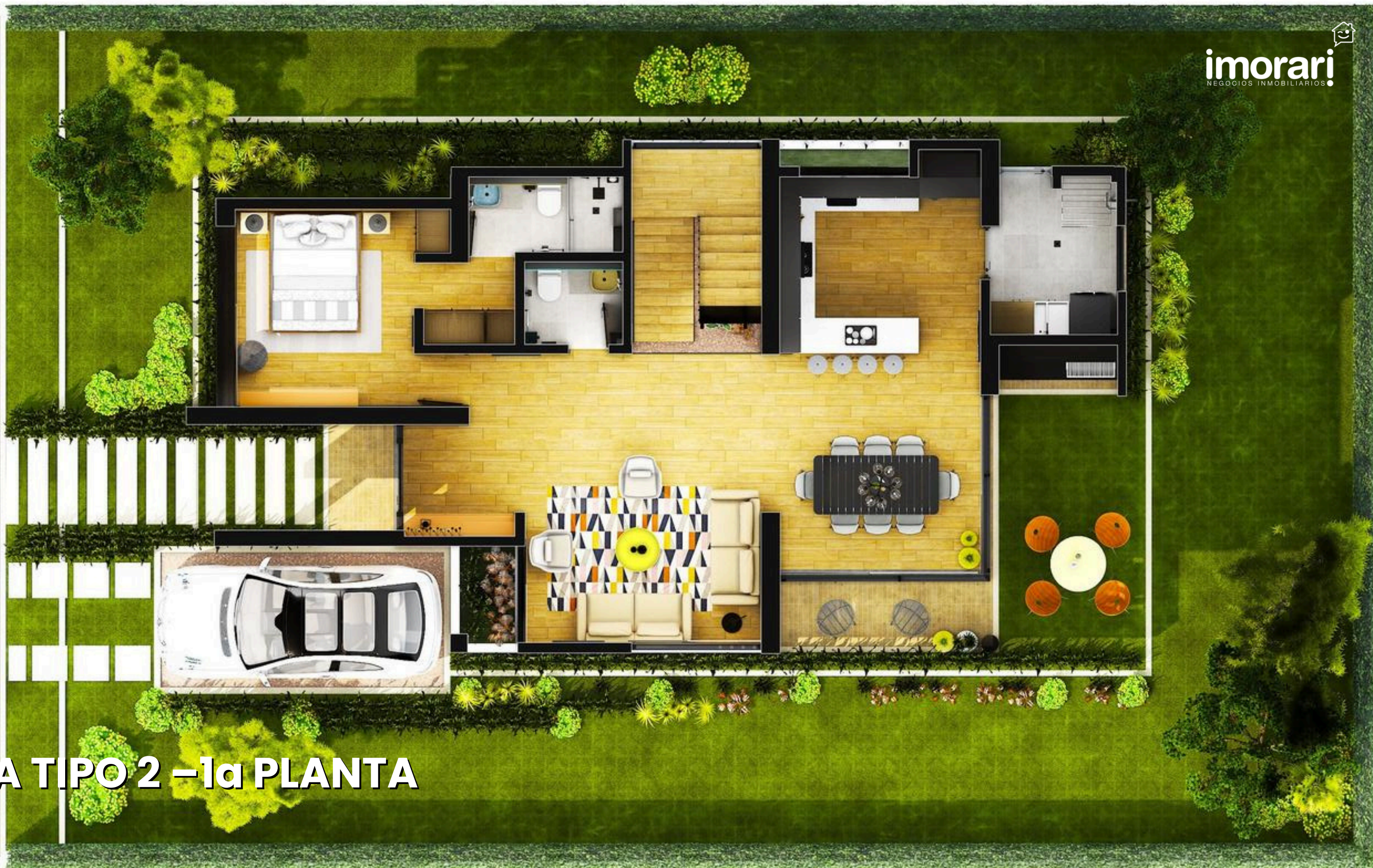
CASA TIPO 2 - 1ª PLANTA