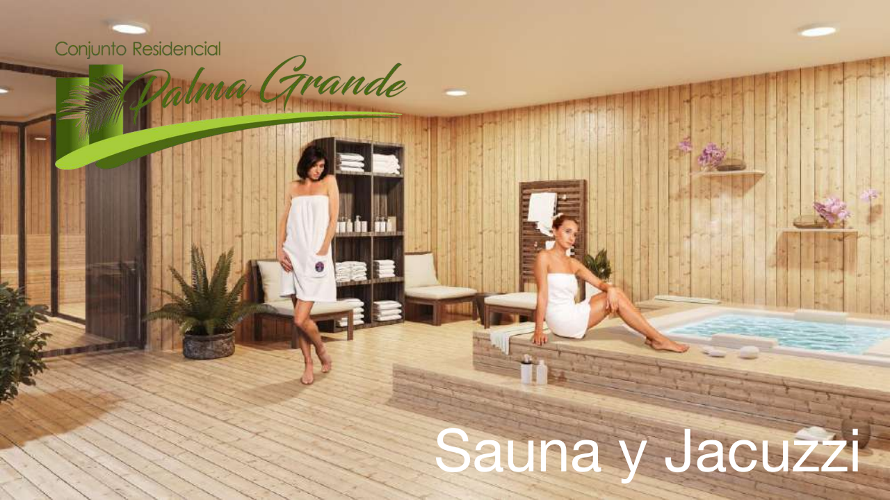
Sauna y Jacuzzi