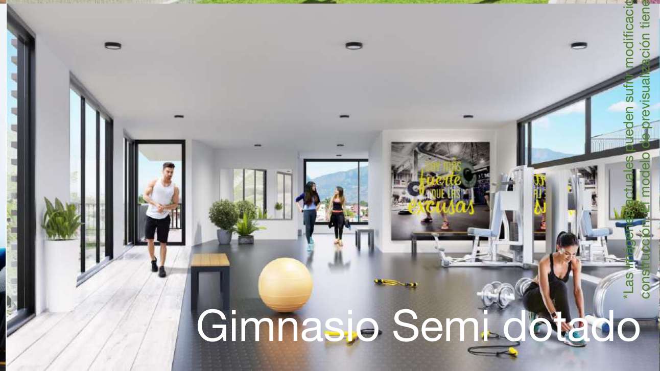
Gimnasio Semi dotado